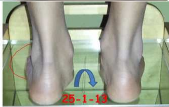
Bimbo di 12 anni alla 1ª visita del 6-7-12: PIEDE CAUSATIVO (piede dx cavo; piede sx piatto)