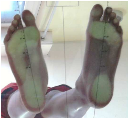
1° VISITA 6-7-12