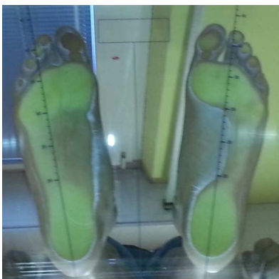
2° CONTROLLO 12-7-13